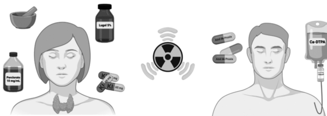
Figura 1. Medidas farmacológicas disponibles antes una situación de irradiación

para facilitar la dosificación y administración en niños. La composición de esta fórmula es 5 gramos de yodo, 10 gramos de yoduro potásico y agua estéril hasta 100 mL. Su estabilidad protegido de la luz en envase de vidrio topacio y a temperatura inferior a 30°C es de 3 meses 18 . La posología recomendada en caso de exposición a yodo radiactivo es de 16 gotas/día (equivalente a 100 mg de yodo activo) en adultos, incluyendo mujeres embarazadas y madres lactantes; 8 gotas/día (50 mg de yodo activo) en niños de 3-12 años; 4 gotas/día (25 mg de yodo activo) en niños de 1 mes a 3 años; y 2 gotas/día (12,5 mg de yodo activo) para menores de 1 mes. El tratamiento debe iniciarse tan pronto como sea posible y repetirse diariamente hasta que el riesgo o la exposición hayan terminado 19 .